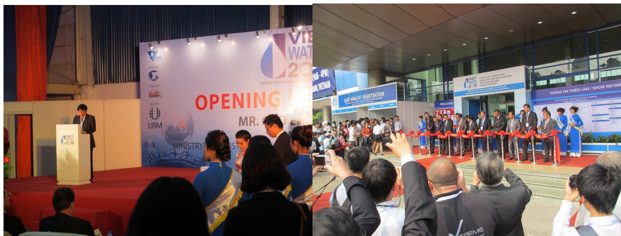
オープニングセレモニーの様子

初日の 11 月 6 日の朝、展示会の開会式が行われ、太鼓や踊り等の後、代表であるベトナム建設大臣から開会宣言がありました。その後、会場前でテープカットが行われ、展示会が華々しくスタートしました。