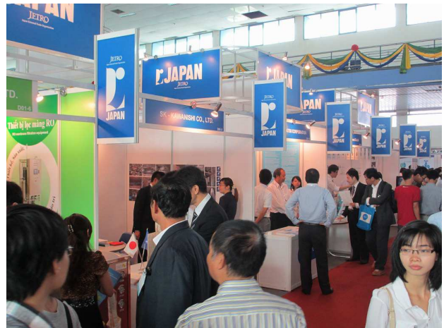
ジャパンパビリオンの盛況ぶり